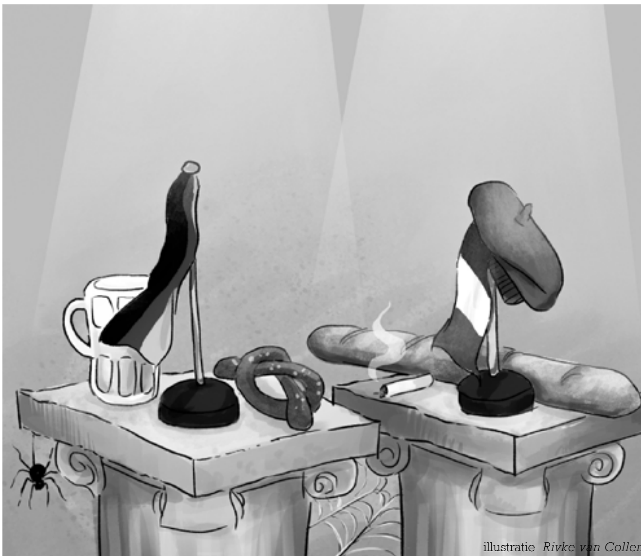
illustratie Rivke van Collem

De strijd tegen verval van talenstudies gaat onverminderd door. In heel Nederland worden de handen ineengeslagen om talenstudies te redden, want ondanks de vicieuze cirkel waar talenstudies in zijn beland, blijft er hoop. Door het standvastige optimisme van de Faculteit der Letteren gecombineerd met de oneindige creativiteit van hun medewerkers raak je overtuigd dat het tij nog kan keren. Aan alle kanten wordt hard gewerkt aan een succesverhaal, maar wel een waarvan de helft nog geschreven moet worden. ANS